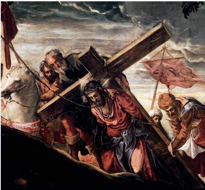
“Subida al Calvario” (detalle). Tintoretto, 1566-67. Scuola Grande di San Rocco. Venecia.

Su objetivo era transmitir emociones más que adaptarse a los cánones de belleza de la época, pinta con pasión, alcanzando en su plenitud su característica audacia, el dinamismo incansable de su composición, su uso dramático de la luz y sus enfáticos efectos de perspectiva que hacen que parezca un artista barroco, un adelantado a su tiempo. De Miguel Ángel toma las anatomías y las posturas difíciles, sus efectos de perspectiva son enfático insertados en un marco muy característico de la escuela veneciana: el color, el paisaje y la luz. Esta última cobra singular relevancia en sus últimas obras, usándola de forma dramática.