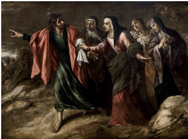
“La Virgen con San Juan y las Marías camino del Calvario”. Juan Valdés Leal, 1657. Museo de Bellas Artes de Sevilla

Juan de Valdés Leal (1622-1690) 23 nacido en Sevilla fue un pintor activo en Córdoba y Sevilla y uno de los máximos representantes del Barroco Español, su pintura es principalmente tenebrista siendo de sobra conocidos los dos jeroglíficos de las postrimerías pintados hacia 1672 para la iglesia del Hospital de la Caridad de Sevilla, donde se conservan, la una Finis gloriae mundi e In ictu oculi la otra, formando parte del programa iconográfico de la capilla, integrado por el Santo Entierro del retablo mayor y la serie de las obras de misericordia pintada por Murillo, con la que forma un conjunto coherente. Su técnica, tan cercana a otros artistas de su generación -como Herrera el Mozo, de quien tanto aprendería-, sabía transmitir el vibrante impulso que gustaba dar a sus composiciones, plenas de movimiento y dinamismo, construidas a menudo dentro de suntuosas arquitecturas y paisajes como el caso que nos ocupa donde los principales personajes aparecen en primer plano seguido por las dolientes.