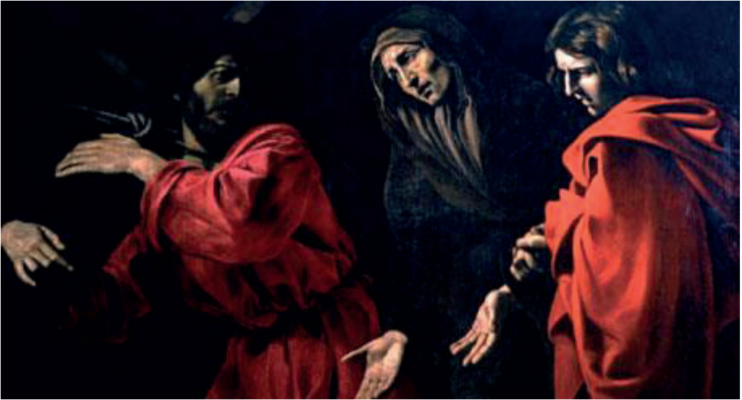
“Camino del Calvario”. Giovan Battista Caracciolo. Museo de Bellas Artes de Capodimonte. Nápoles.

Giovanni Battista Caracciolo 24 (1578-1635), nació en la ciudad de Nápoles donde desarrolló toda su faceta artística, fue un pintor napolitano del Barroco y uno de los mejores seguidores que gravitaron en torno a las influencias de Caravaggio, junto con el español José Ribera, encabezando a una brillante generación de pintores barrocos en Nápoles a lo largo del siglo XVII. La llegada de Caravaggio a Nápoles a finales de septiembre o principios de octubre de 1606 fue decisiva en su carrera adoptando con los postulados estilísticos que el gran maestro lombardo trajo consigo. De hecho se le considera como el fundador de la escuela napolitana de Caravaggismo. Como se muestra en la obra escogida, Camino del Calvario, denota una paleta sombría, enorme dramatismo, y consiguió una gran monumentalidad en sus figuras gracias a su conocimiento del trabajo de diversos escultores contemporáneos y supo jugar con maestría con los efectos violentos de la luz sobre las superficies, haciendo suyo el profundo claroscuro de Caravaggio, llegando a ser el mayor representante de la escuela tenebrista tras la muerte de Merisi. Su obra se caracteriza igualmente por una austeridad en la composición y su silenciosa intensidad son el toque personal de Caracciolo.